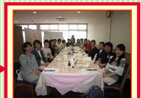
パーティ&表彰式 仲間と楽しい一時を♪