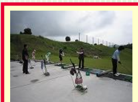
スタート前レッスン① 280Yの広々レンジにて