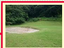
スタート前レッスン② アプローチ&バンカーも