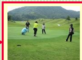
ラウンドレッスン コース戦略を学ぼう!