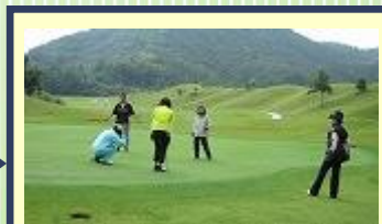
ラウンドレッスン(午前のみ) コース戦略の考え方を学ぼう