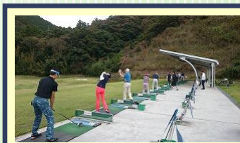
スタート前レッスン(参加自由) コンディショニングと最終調整