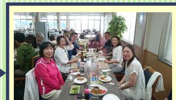
パーティ&表彰式 仲間と楽しい一時を♪