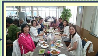
パーティ&表彰式 仲間と楽しい一時を♪