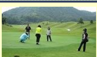
ラウンドレッスン(午前のみ) コース戦略の考え方を学ぼう