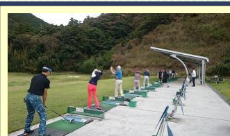
スタート前レッスン(参加自由) コンディショニングと最終調整