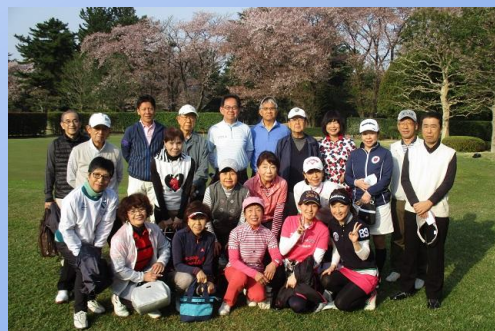
(2018お花見コンペ集合写真)