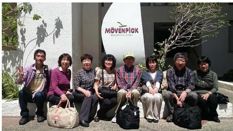
ホテルを出る直前、ホテルの玄関前で全員で