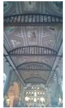
人口の約95%がキリスト教徒です