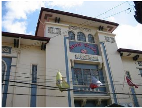
フィリピン最古の教会「セント・ニーニョ教会」