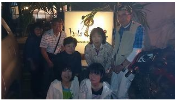
2日目の夕食はスペイン料理の店「オラ・エスパーニャ」