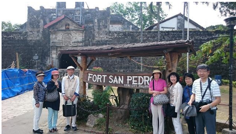
スペイン統治時代に造られた軍事要塞「サンペドロ要塞」