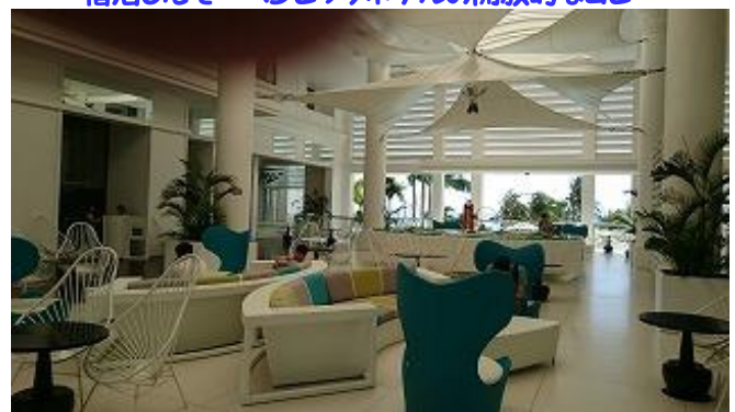
宿泊したモーベンピックホテルの開放的なロビー