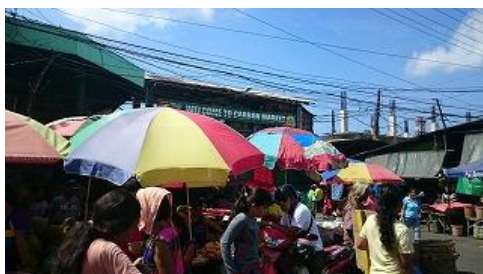
地元の人で賑わう「カルボンマーケット」