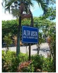
クラブハウスと入口看板 (意外と小さい)