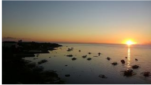
部屋から見た日の出、幻想的でした・・・