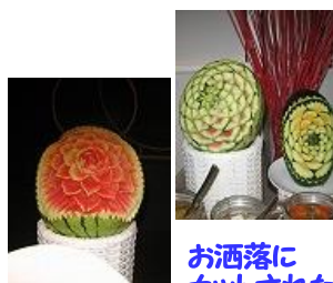
お洒落に カットされた フルーツ