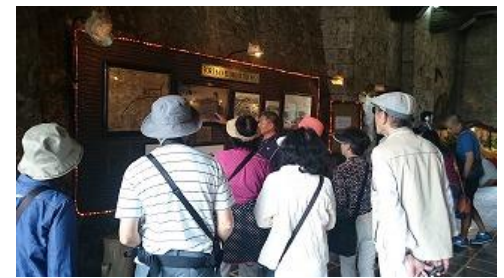
ここではセブの歴史を学びました