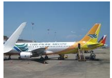
帰国の便、フィリピン航空PR436