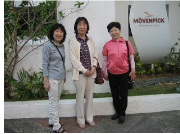
ホテルの玄関前で