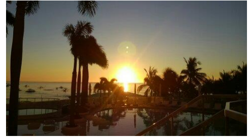
こちらはプールサイドから見た日の出