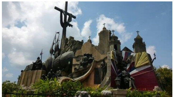
セブの歴史をモチーフにした「セブ遺産モニュメント」