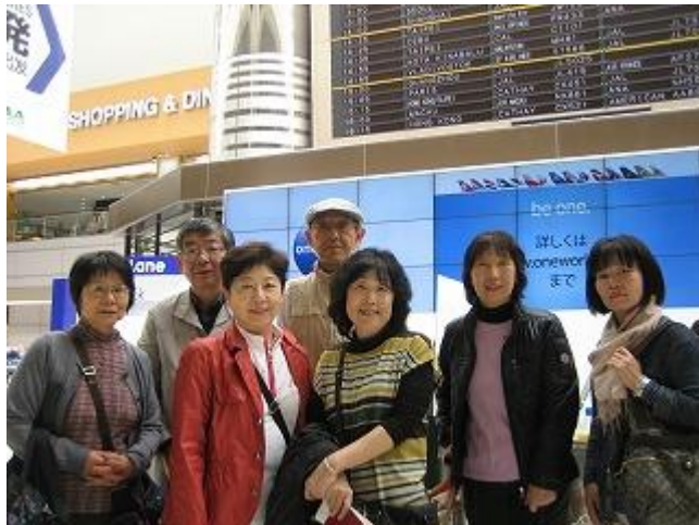
出国前の成田空港にて