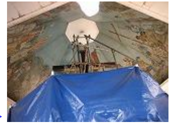
マゼラン・クロスは、残念ながら改装中でした→