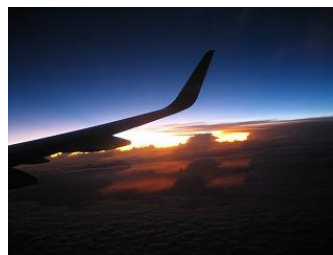
←行き機内からみた夕日