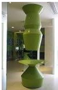
↑ここは何処? 何とイシです