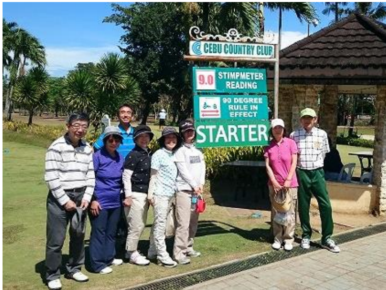
トーナメントも開催される 名門セブカントリークラブにて