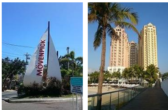
ホテルの入口と外観↑