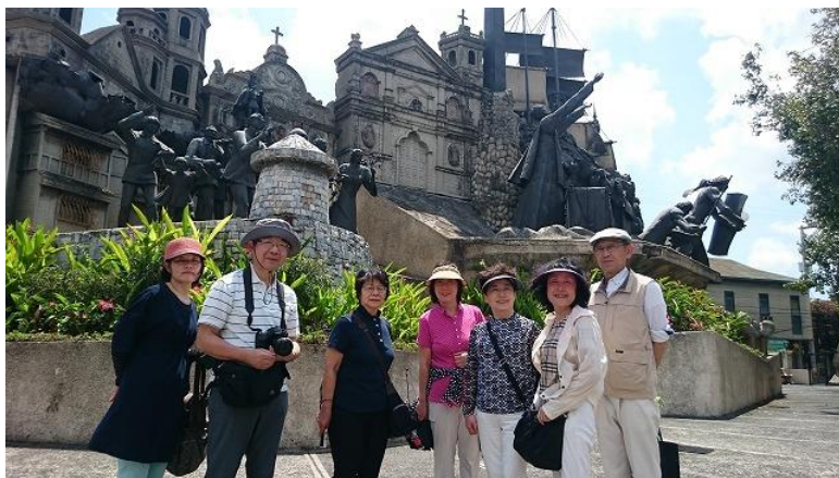
「Heritage of Cebu Monument(セブ遺産モニュメント)」にて