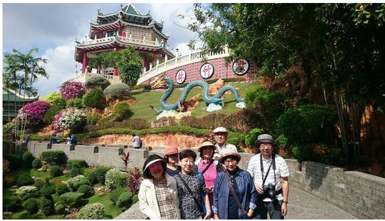
高級住宅街「ビバリーヒルズ」にある「道教寺院」