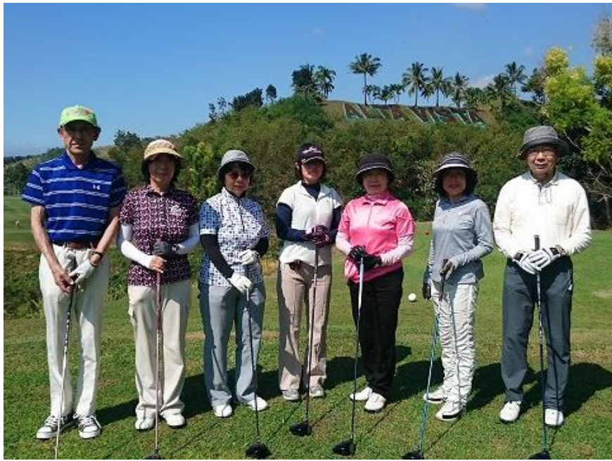
アルタヴィスタゴルフ&C.C.にて 後ろに「ALTA VISTA」の文字が..