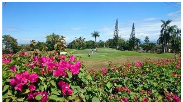
アップダウンのある難コースですが、南国ムードたっぷりのゴルフを楽しみました!