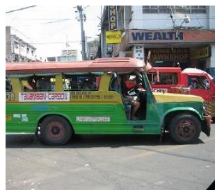
乗り合いバス「ジプニー」