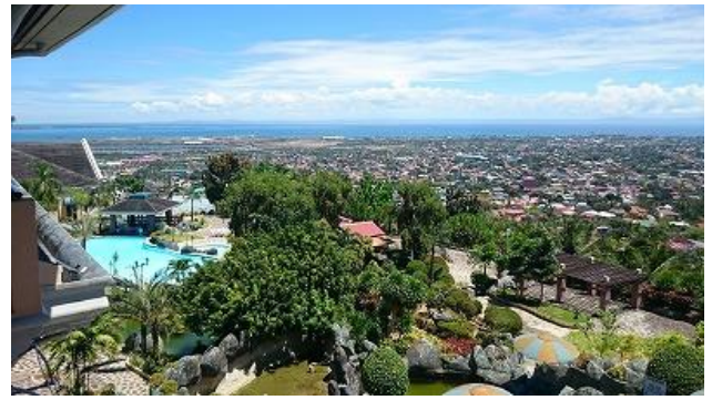
アルタヴィスタから、眼下に広がるセブ中心街と青い海