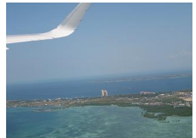
機内からホテルが見えましたセブ島、ありがとう!!