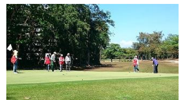
フラットながら距離があり、戦略性に富んだタフなコースでした