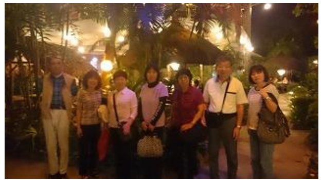
3日目の夕食はフィリピン料理で「マリバゴ・グリル」