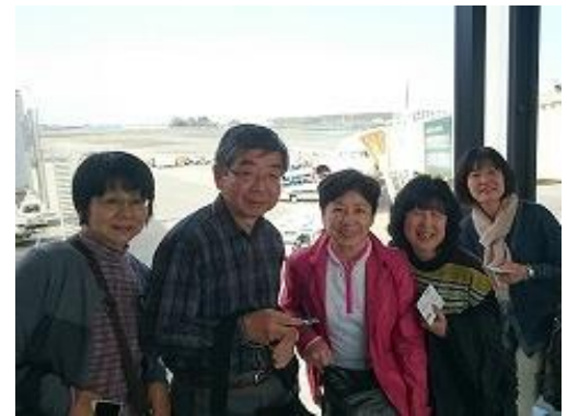
搭乗機の前でハイチーズ