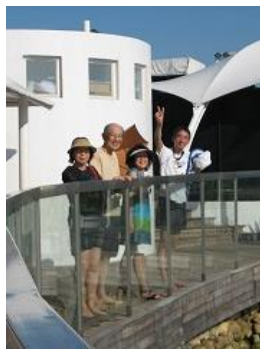
ウッドデッキにて