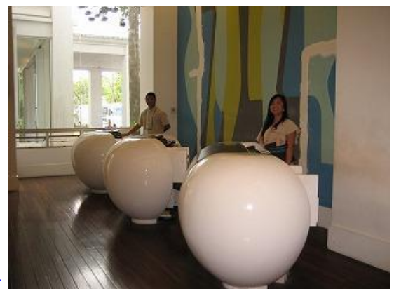
こう見えて ホテルのカウンターです→