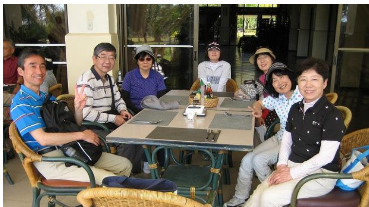
セブカントリーのレストランはテラス席