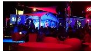
最後の夕食はちょっとリッチに！ホテルのレストラン「イビサ・ビーチ・クラブ」で、ショーを観ながら・・・