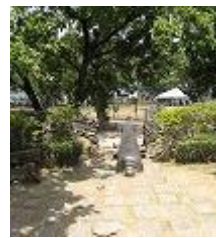
今も残る大砲 戦争の爪痕..