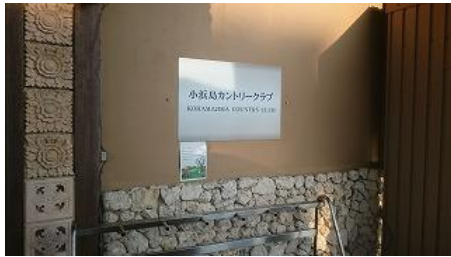
ありがとうニラカナイ小浜島!