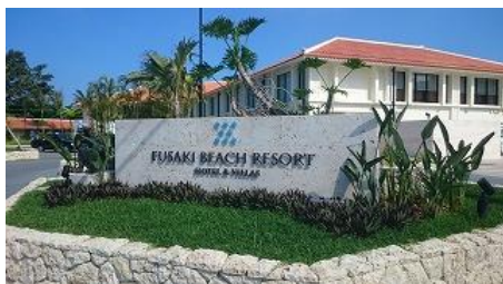
フサキリゾートの入り口です