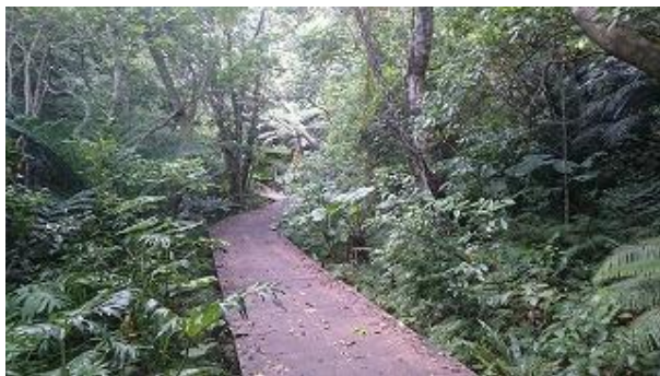
「バンナ公園」のホタル街道