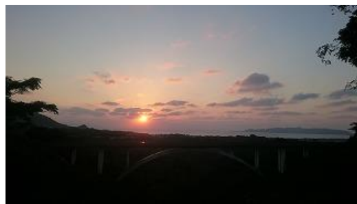
バンナ公園内「ホタル滝展望台」から見たサンセット