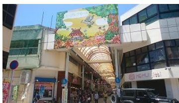
ユーグレナモールでお買い物