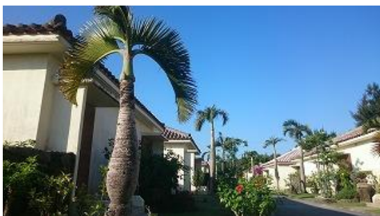
部屋はコテージタイプです