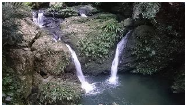
日没後はこの滝の周囲にヤエヤマボタルが・・