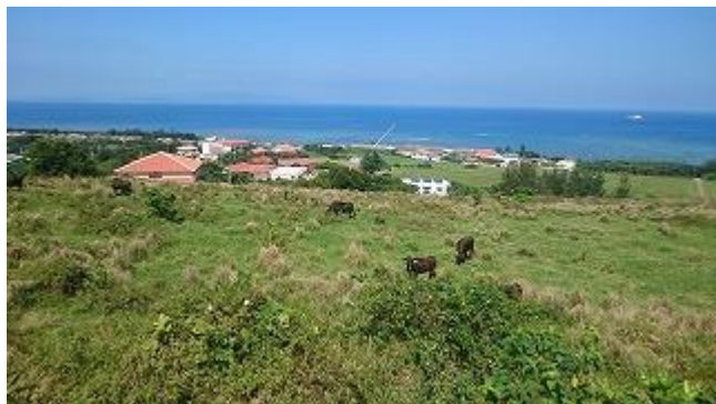
ミルミル本舗からの景観、フサキリゾートを眼下に