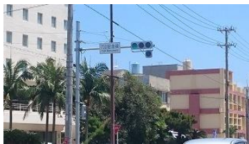
「730記念碑」の由来は、昭和53年7月30日に行われたから