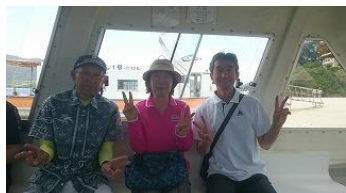
グラスボートの中からパチリ