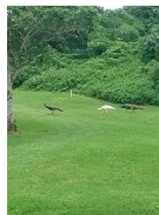
コースでクジャクに遭遇! 隣接するホテルで飼われていたものが逃げ出し野生化したとか。カート道で求愛行動も...