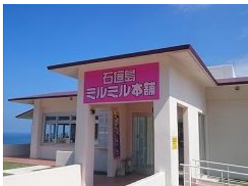
牧場直営のジェラートのお店「ミルミル本舗」