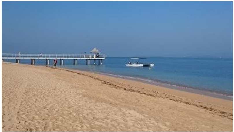
サンセットで有名な栈橋「フサキ エンジェルピア」