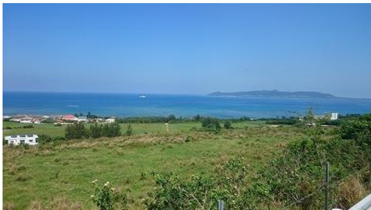
海の向こうに見えるは小浜島