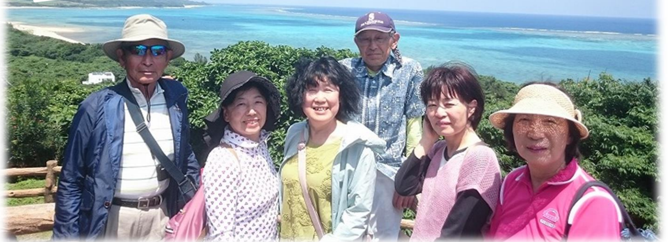
島の東側「玉取崎展望台」からは太平洋と東シナ海を一望