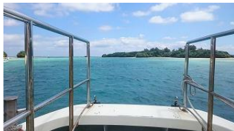
グラスボートの船首から