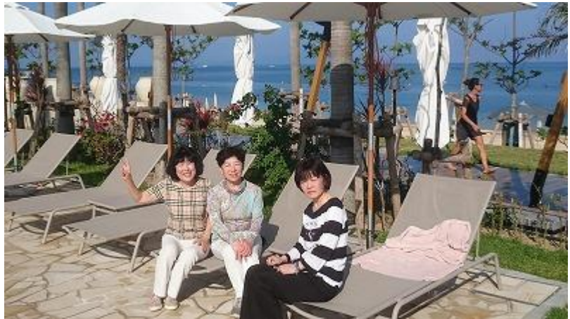
プールサイドでのひと時・・