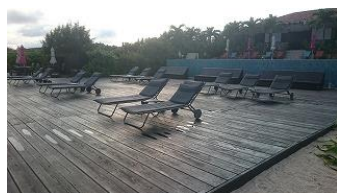
ホテルにある3つのプールの一つ「ラグーンプール」とビーチ