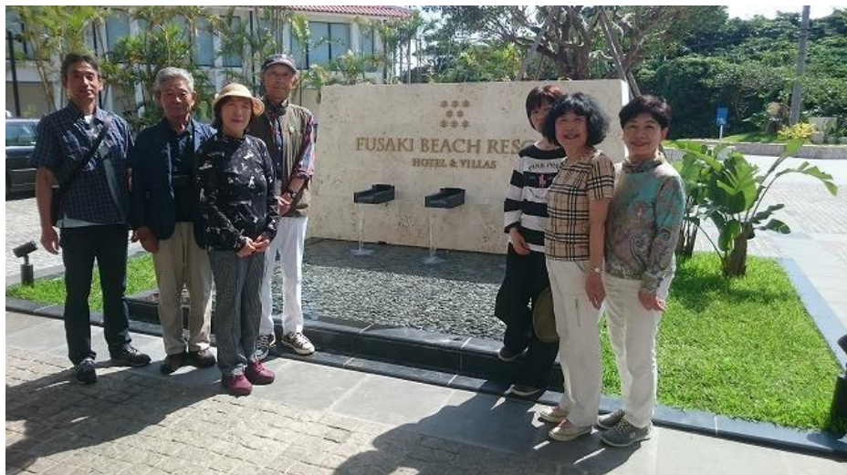
フサキリゾートの入り口前で、皆で記念撮影