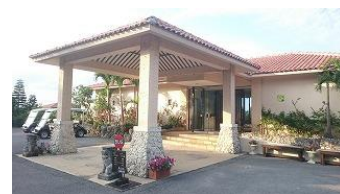
部屋はコテージタイプの「ホテルニラカナイ小浜島」