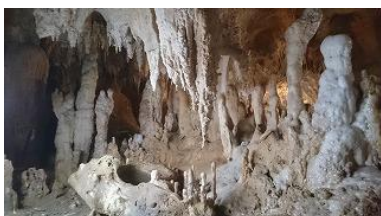
珊瑚礁から生まれた鍾乳洞はまるで天然の彫刻