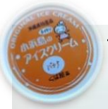
小浜島のご当地アイスクリーム