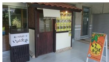
島での最後の食事はココで