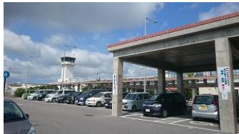
南め島(ぱいめしま)石垣島空港へ