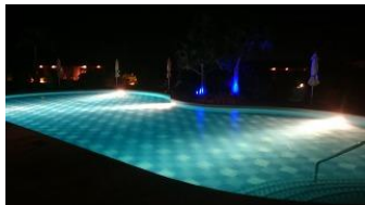
ビーチハウスプールとライトアップされたクラブハウスプール