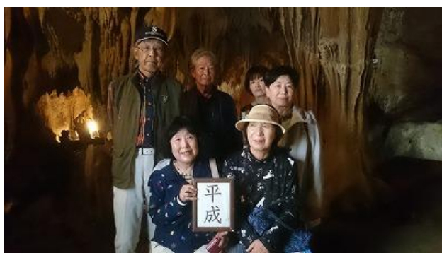
「平成」最後のツアーでした