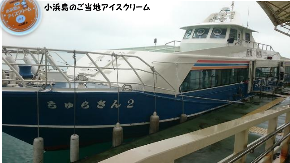
ゴルフの後は、この高速船で小浜島を離れ、石垣島へ・・・