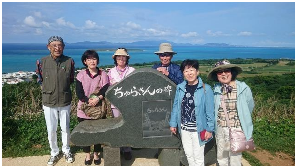
八重山の展望台、小浜島の最高峰「大岳(ふうだき)」