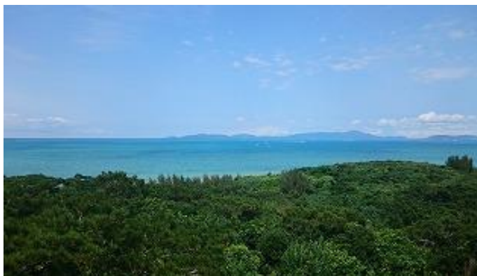
部屋からは石垣島も見えます