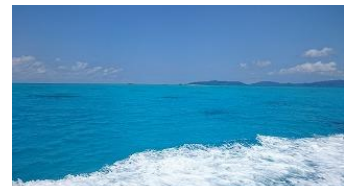
小浜島へは離島ターミナルから高速船で約25分 いざ小浜島へ!