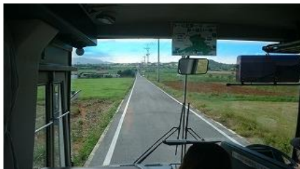
ちゅらさんの通学路「シュガーロード」