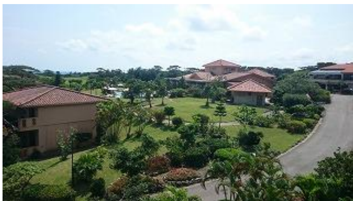
部屋からの景色、ゴルフコースやプールが見えます