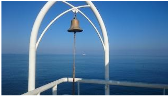
栈橋の先端にある鐘、この鐘を鳴らすのは？