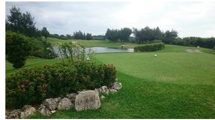
池越えて美しい最南端12番ホール