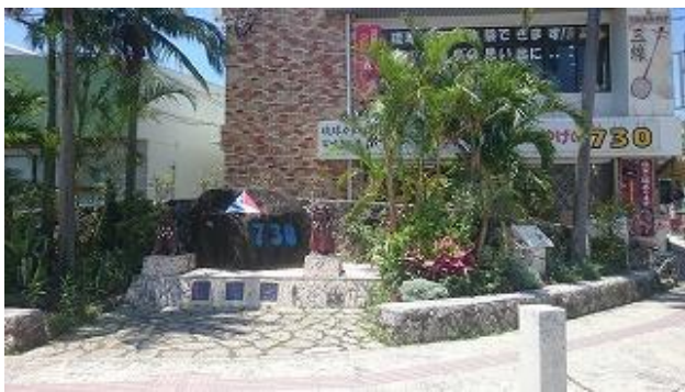
車の左側通行移行を記念した「730記念碑」