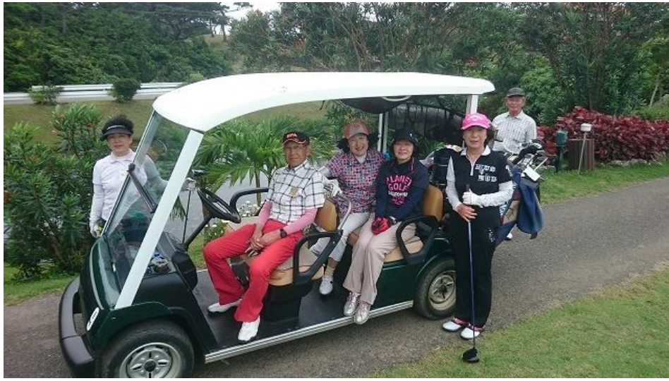
スタート前、1番ホールにて 何とかお天気が持ちますように・・・