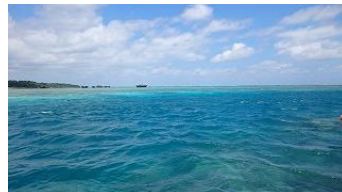
見事なカビラブルー