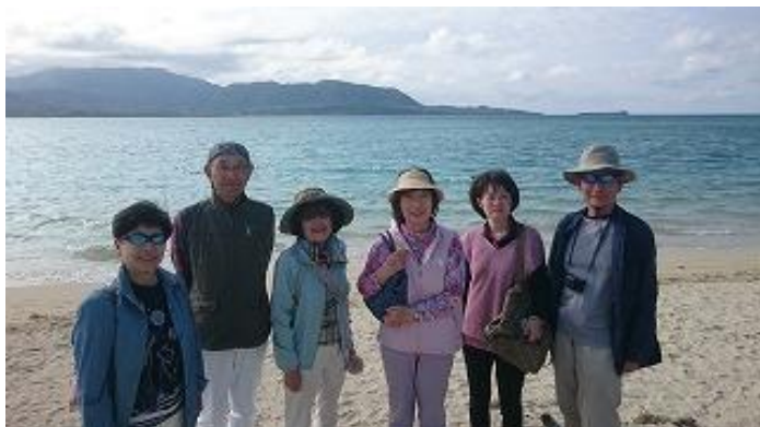
小浜島の南西端「細崎(くばざき)」の目の前に西表島が・・・