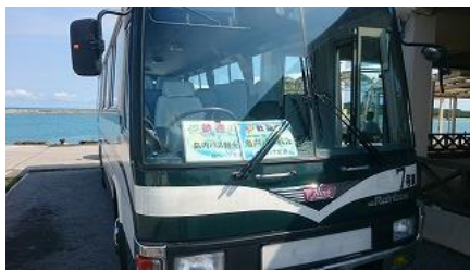
観光バスで島内観光へ