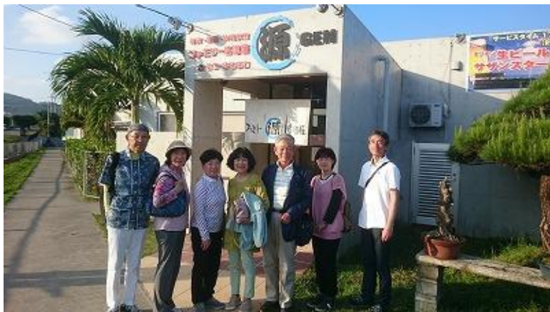
4日目の夕食は少々早めに「ファミリー居酒屋 源」にて