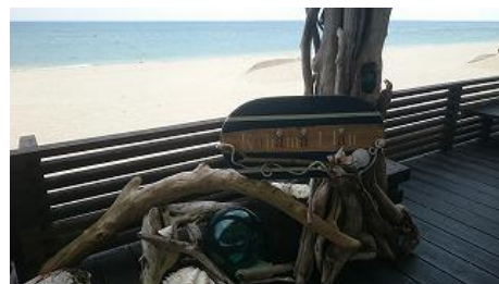
ゴルフの後はビーチへ! 少々肌寒く、人っ子ひとりいない...