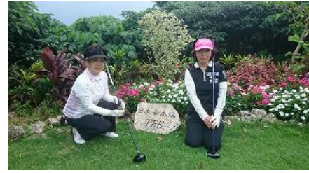
7番のティエリアが最西端