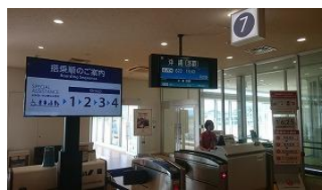
帰路はこの飛行機で・・・石垣島＆小浜島、思い出をありがとう!!