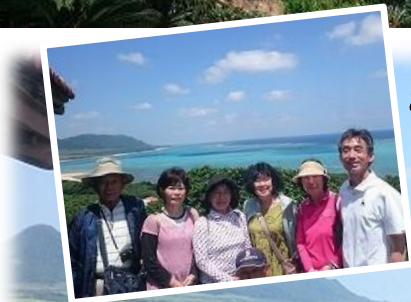
あれれ・・・？一人いない!(汗)