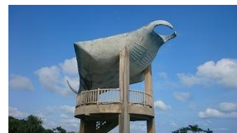
「海人(うみんちゅ)公園」のシンボル、巨大マンタ