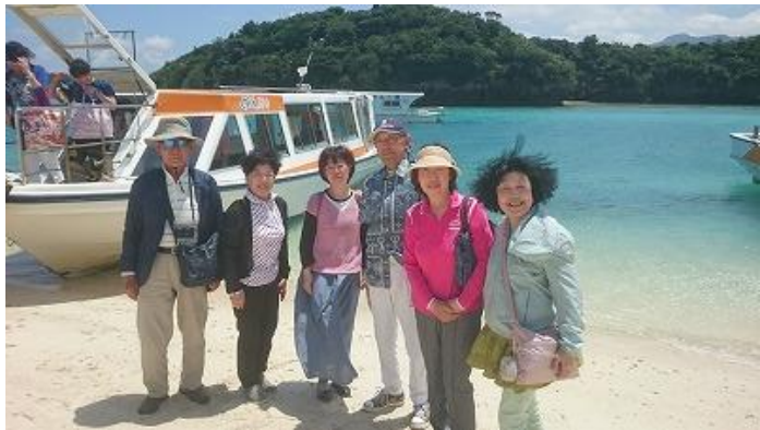
川平湾ではグラスボートに乗りました