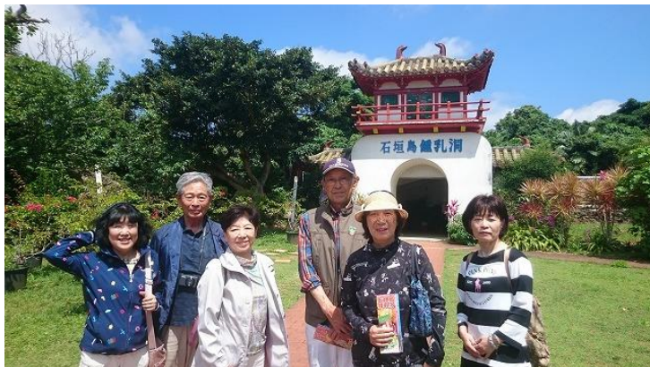
本ツアー最後の観光スポットは「石垣島鍾乳洞」