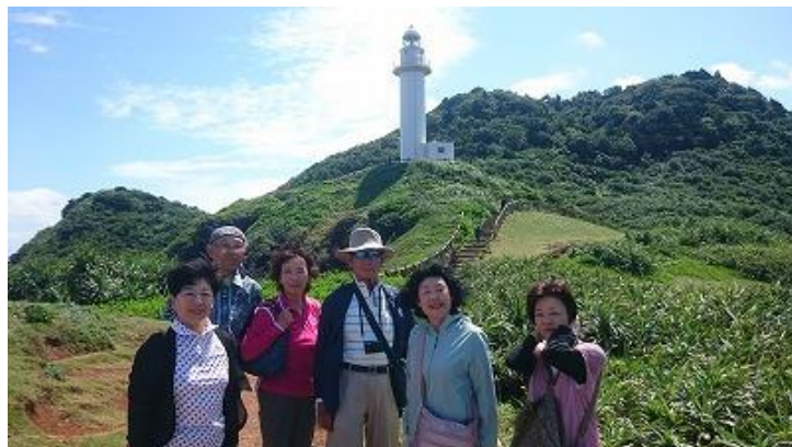
石垣島の西に張り出した岬「御神崎(うがんざき)」