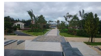
今日からの宿泊先「フサキビーチリゾート ホテル&ヴィラズ」にチェックイン