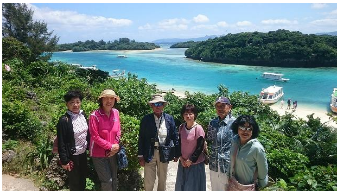
石垣島屈指の景勝地「川平湾(かびらわん)」にて