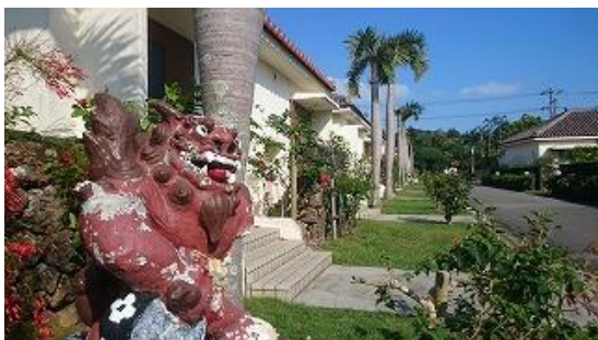
コテージは沖縄独特の赤瓦