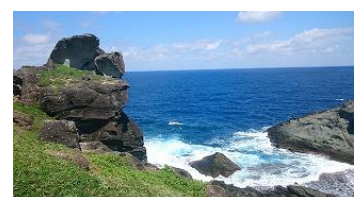
(写真下)左の岩はカエル岩?