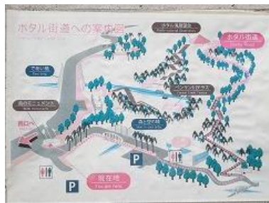
ヤエヤマボタル鑑賞はこの案内板を頼りに・・